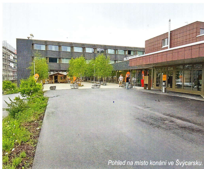
Pohled na místo konání ve Švýcarsku.

Organizace soutěže byla vynikající. Soutěžilo se v prostorách Bildungsparku SVP, což je vzdělávací centrum SPV (Schweizerische Plattenverband) především pro obkladače se zázemím, odborným personálem, kterému se nemůže nikdo v současnosti vyrovnat. Navíc v minulém roce dokončili